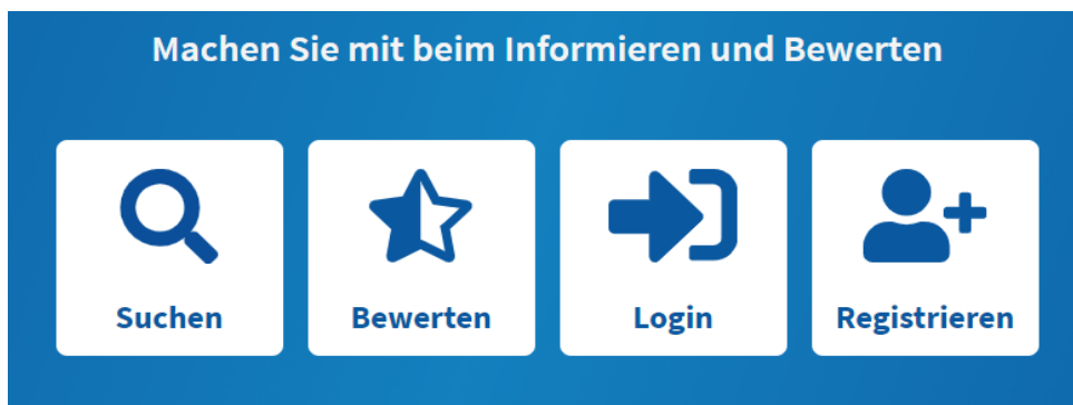
Abbildung 3 Kachelmenü, über das die wichtigsten Funktionen direkt anwählbar sind.

Die Unterseiten Suchen und Bewerten und Eintragen und Bewerten von Produkten wurden ergänzt durch ein Kachelmenü, das direkt und einfach zu den möglichen Aktivitäten der Anwendung führt.