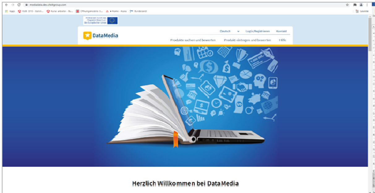
Abbildung 2 Startseite der Anwendung „DataMedia“

Die Startseite von DataMedia bietet neben Informationen und Erklärungen zu MediaData und dem dahinterstehenden Projekt DigitMedia ein Menü mit den Möglichkeiten